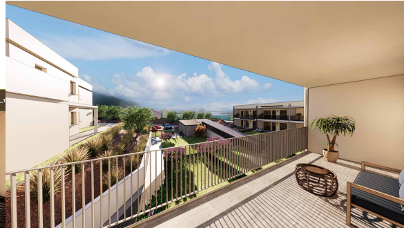
Haus 2__OG-Top 04