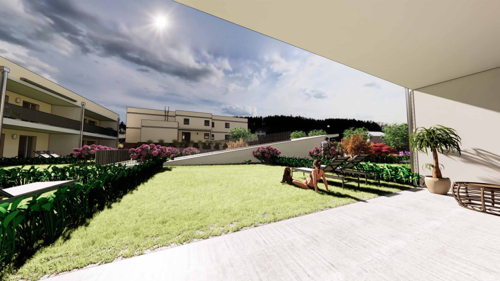
Haus 1_EG-Top 03